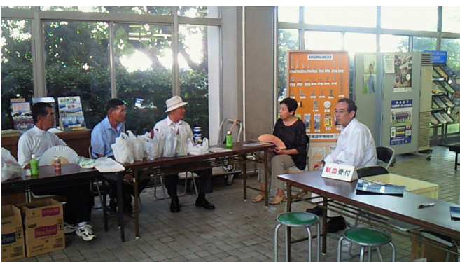
献血協力8月(献血者にワインを進呈しています)

また、十二月十日(金)には、クラブ結成一周年記念例会と忘年例会が阿波観光ホテルで開催され、圃山会長も訪問参加をしていただきました。その答礼として、当クラブの第一例会・新年例会には、六名の方々の訪問があります。