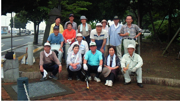
しおかぜ公園トルハルバンの前で

当日は、十七名のライオンズメンバーが参加し、しおかぜ公園周辺の樹木の剪定、除草、ゴミの収集等に二時間汗を流しました。ご協力ありがとうございました。