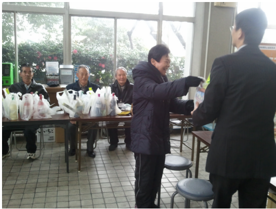
協力者にワインを進呈しています