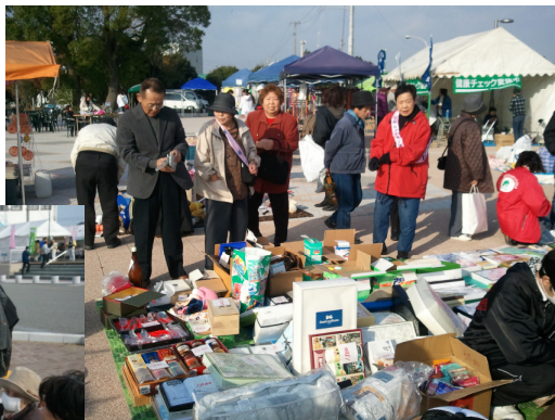
多くの商品を集め 頑張って収益を上げました