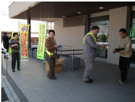
振り込めサギ防止キャンペーンの協力の風景