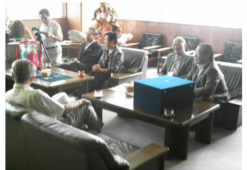
韓国人形を小松島市に寄贈