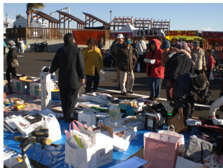
バザーに参加して 売り込みの風景