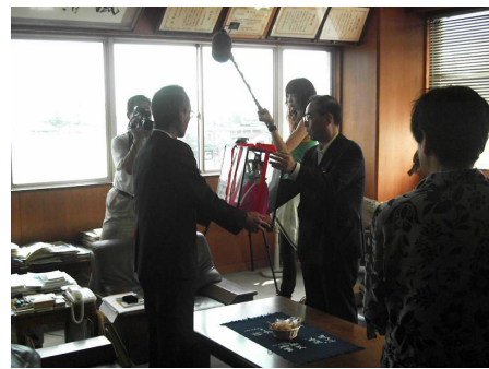
四国放送の取材も受けました。