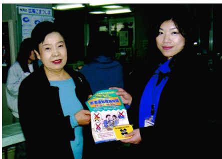
献血奉仕 献血者にはワインを贈呈