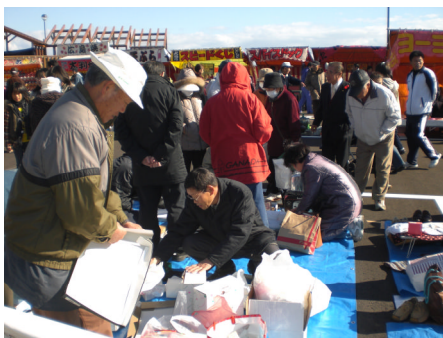
上) うまいもん祭りでのバザーに参加 左) 剣道大会の風景