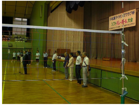
小松島ライオンズ杯ソフトバレーボール大会