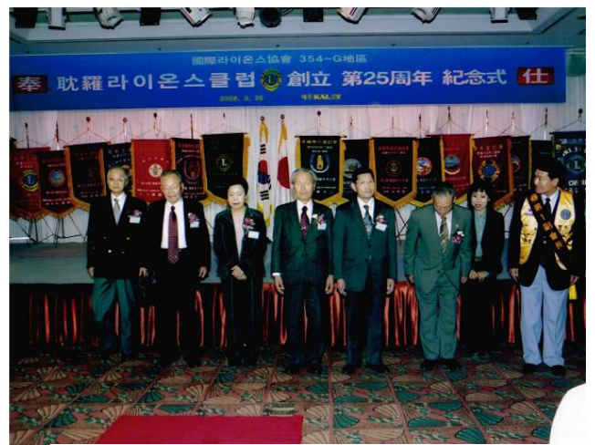
耽羅ライオンズクラブを訪問した時