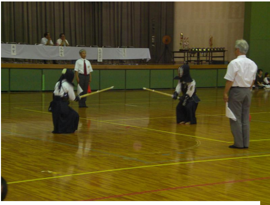
坂野少年剣道練成大会の風景