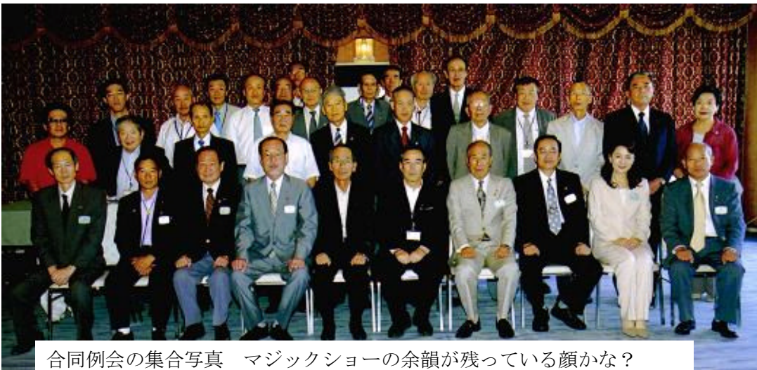
合同例会の集合写真 マジックショーの余韻が残っている顔かな？