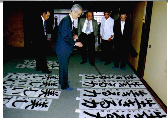
10月25日に真剣に審査する 県下学童書道展の審査風景